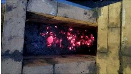
<仕上げに豆炭で煉瓦を燃やした様子>