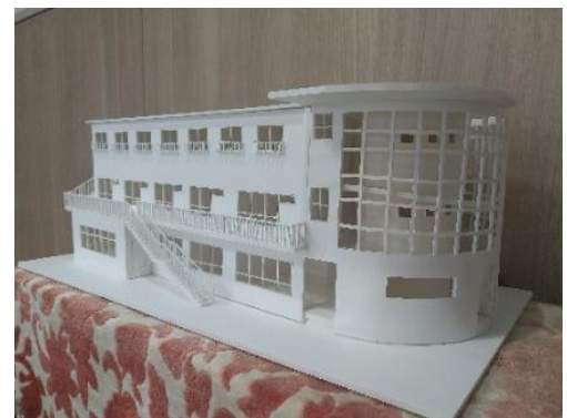
<前中津学園園舎模型>